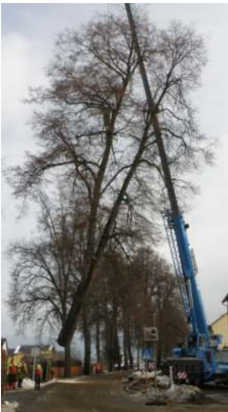
DI Heribert Bogensperger

Mit freundlichen Grüßen Ihr Bürgermeister